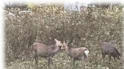
日光修学旅行2日目朝宿泊部屋窓から撮影

関係機関の皆様、地元自治会、ボランティアの皆様等の御尽力により、通学路の安全対策がまた一つ実現いたしました。関係された皆様にはこの場を借りて厚く御礼申し上げます。詳細は別紙を御確認ください。