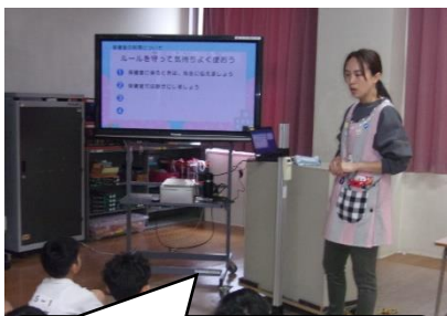
保健室の4つのやくそくは保健室前にも掲示。

4月10日(金)、14日(火)に発育測定を実施しました。発育測定前に「保健室のおやくそく」と「身長・体重の測り方」について保健指導を行いました。どの学年の子どもたちも、話を聞く姿勢や反応に、一段と成長した様子がうかがえ、とてもうれしく感じました。これからの成長がますます楽しみです。保健指導の様子を一部紹介します。