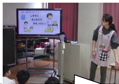
「しずかに まんやかに 気をつけピッ」