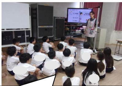
「かかと」「おしり」「あたま」の三点をはしらにつけよう。